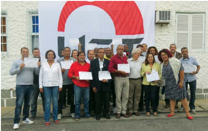
Turma Sindicalista Lindolfo Carneiro Maciel

Sessenta e seis lideranças já foram certificadas. Até o final de 2016, outras duas turmas serão formadas.